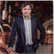
Ignacio Rivera CEO de Corporación Hijos de Rivera