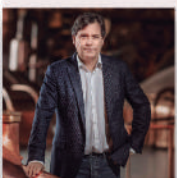
Ignacio Rivera CEO de Corporación Hijos de Rivera