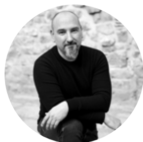
Josep Ferrando Josep Ferrando Architecture