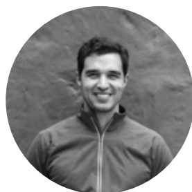
Fernando Alonso Herzog & de Meuron