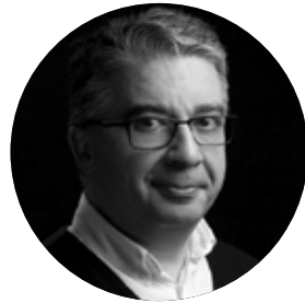
José Ramón Puerto Puerto & Sánchez Arquitectos