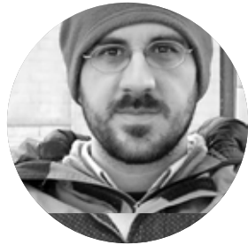
Carolo Losada E3 Arquitectos