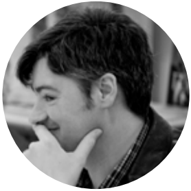
Alberte Perez Trespes Arquitectos