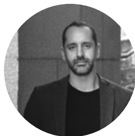
Carlos Graña SEA Arquitectos