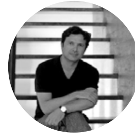
Jovino Martinez JMS Arquitectos